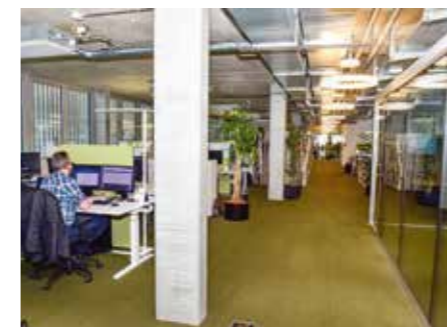
... das Arbeitsumfeld der netrics AG jedoch ist frisch, warm und hat sehr viel «Swissness».

Beim ersten Besuch wird sofort klar, warum dem so ist. Zuerst parkiert man vor einem rechteckigen