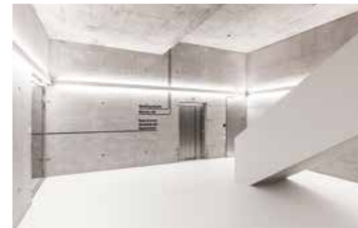
hub:biel: Gebäude und Empfang sind eher kühl gehalten...

Ergebnisse von Operationen durch den Einsatz neuester Technologien wie Cloud Computing und künstlicher Intelligenz massgeblich verbessern – das ist Digitalisierung. netrics – der Partner für die sichere und nachhaltige Realisierung Ihrer digitalen Zukunft!